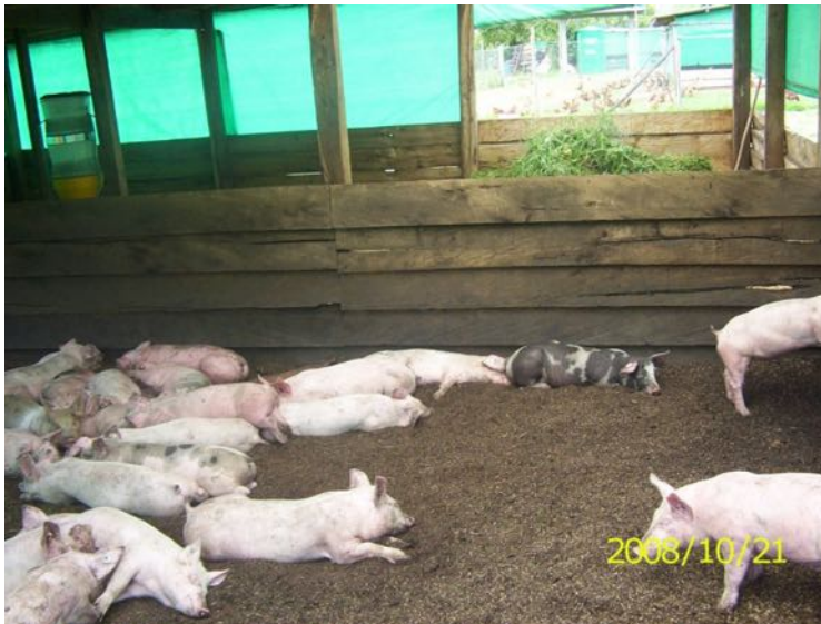
Imagen N° 16. Cerdos criados en un ambiente saludable y sin moscas. Colombia

También se puede aplicar EM en los depósitos de estiércol.