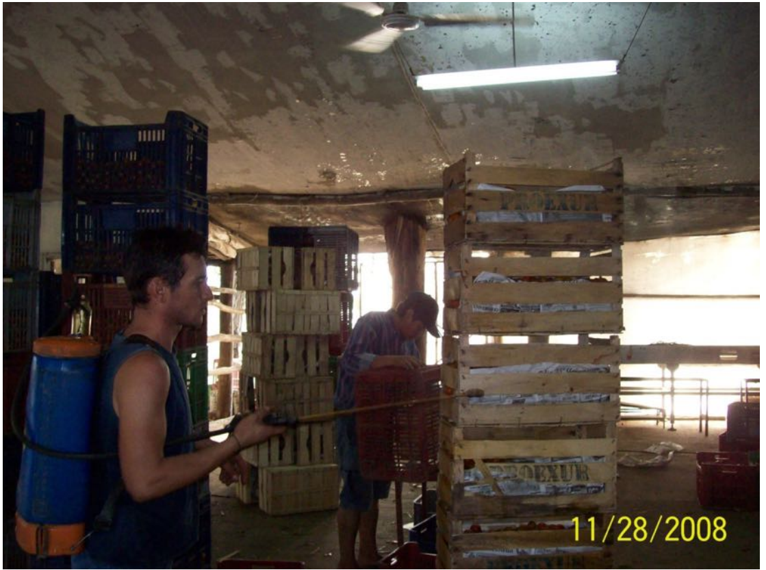
Imagen Nº 13. Aplicando EM en cajones de hortalizas prontos para el mercado. Sapriner. Bella Unión