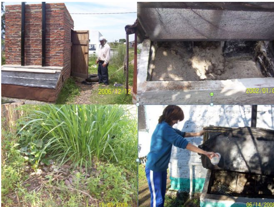
Imagen Nº 10. Superior izq. Vista general de un baño seco. Inf. Izq. Sistema de depuración de las aguas cloacales. Sup. der. Cámara de compostaje de las heces. Inf. Der. Aplicando EM en la cámara de compostaje. Las Láminas, Bella Unión.