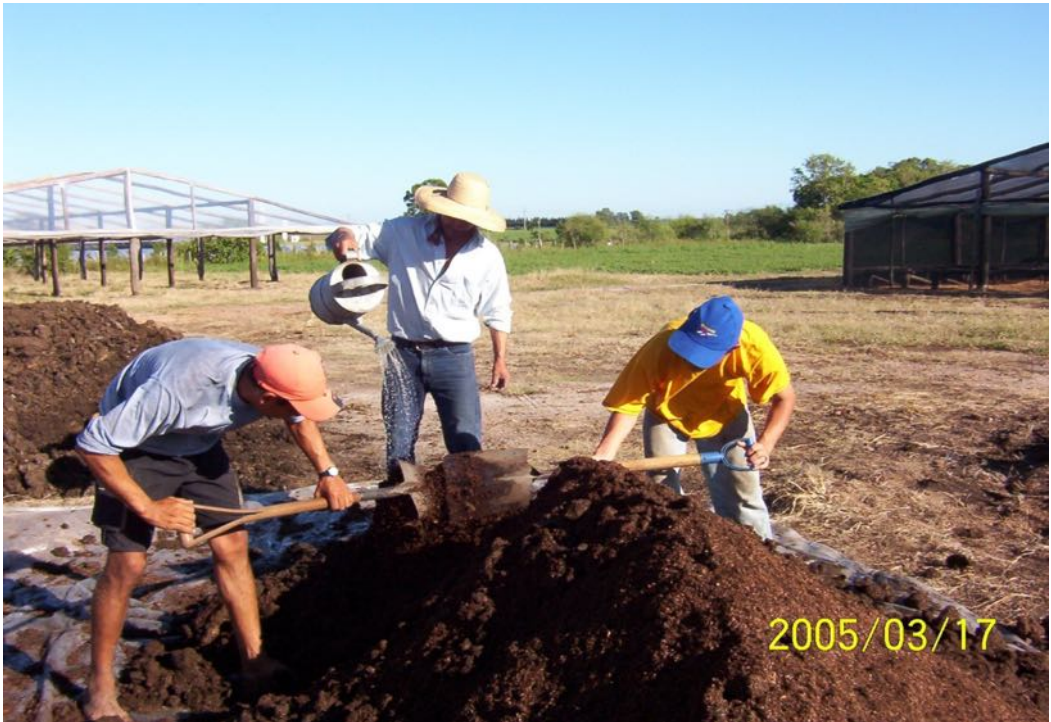
Imagen N° 12. Regando con EM el sustrato para almácigueras