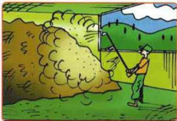
Imagen Nº 15. Aplicación de EM en establos