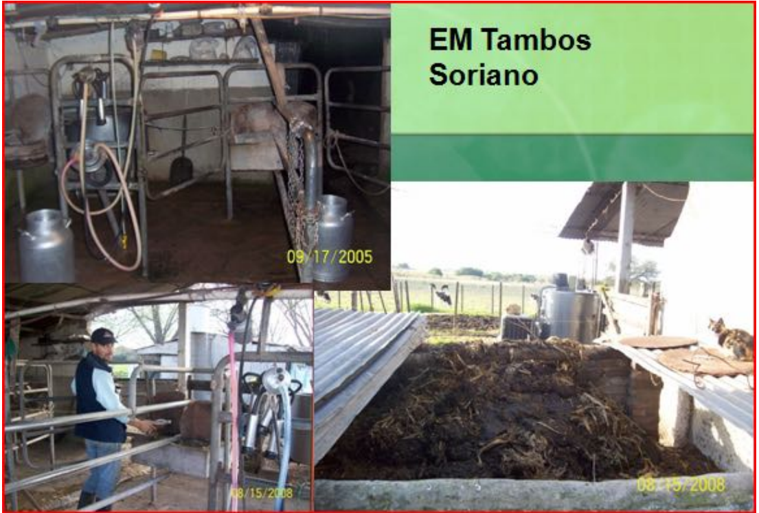
Imagen Nº 14. El EM aplicado en el local de ordeño y en el estercolero disminuye los olores desagradables y las moscas del t ambo. Soriano