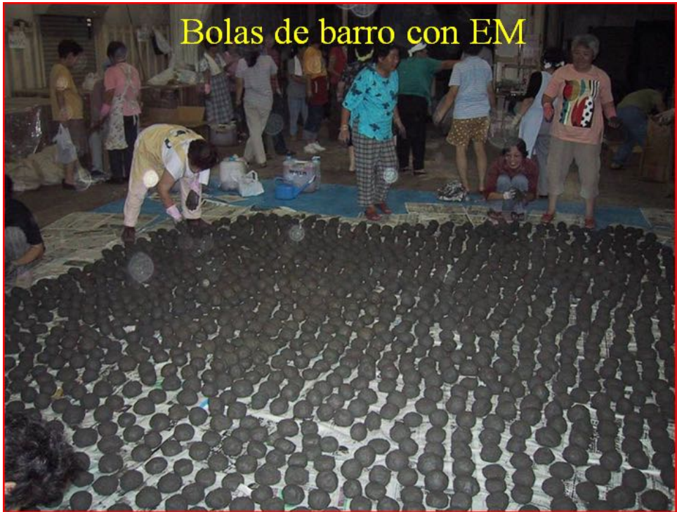
Imagen Nº 8. Voluntarios preparan bolas de barro con EM para su aplicación en una laguna