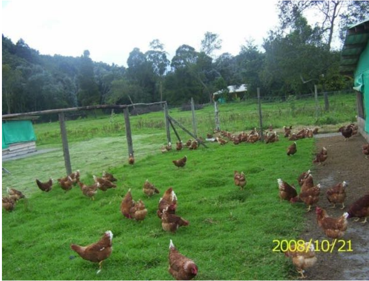
Imagen Nº 17. Producción de huevos orgánicos con EM. Colombia