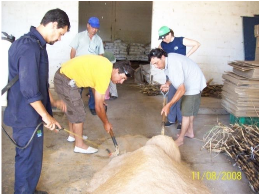
Imagen N° 5. Rociando la mezcla de afrechillo y harina de pescado con la solución de EMA, agua y melaza