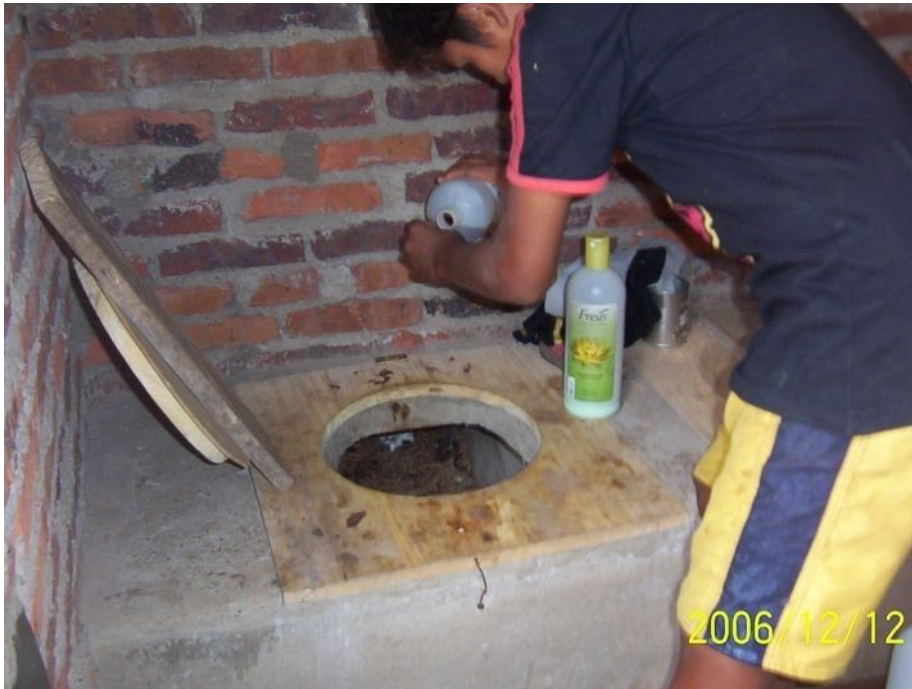
Imagen Nº 9. Aplicando EM Activado en el inodoro del baño seco. Las Láminas, Bella Unión