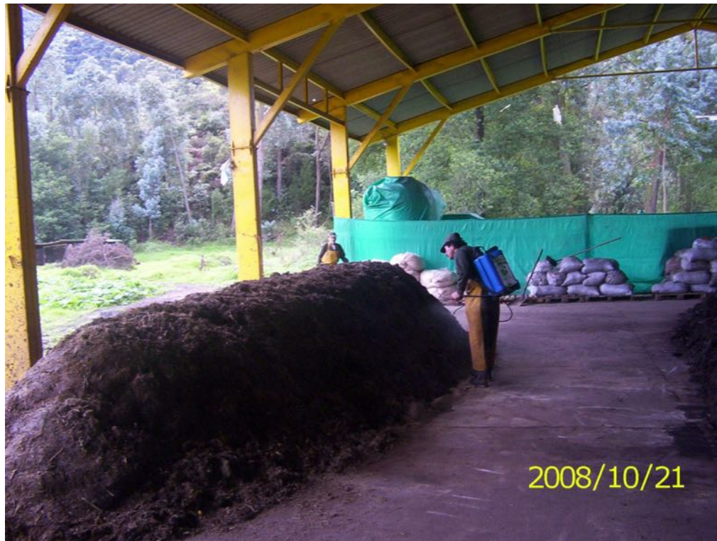
Imagen Nº 11. Preparación de EM ☐ Compost con restos de un cultivo de rosas. Colombia

Si bien el Bokashi es un abono orgánico de mayor calidad, tiene el inconveniente que necesita materias primas más costosas (afrechillo, harina de pescado), que deben ser partículas de tamaño pequeño y que además se necesita bolsas o contenedores para su fabricación. Por esta razón el EM – Compost resulta más práctico si queremos aprovechar grandes cantidades de residuos agrícolas para mejorar los suelos.