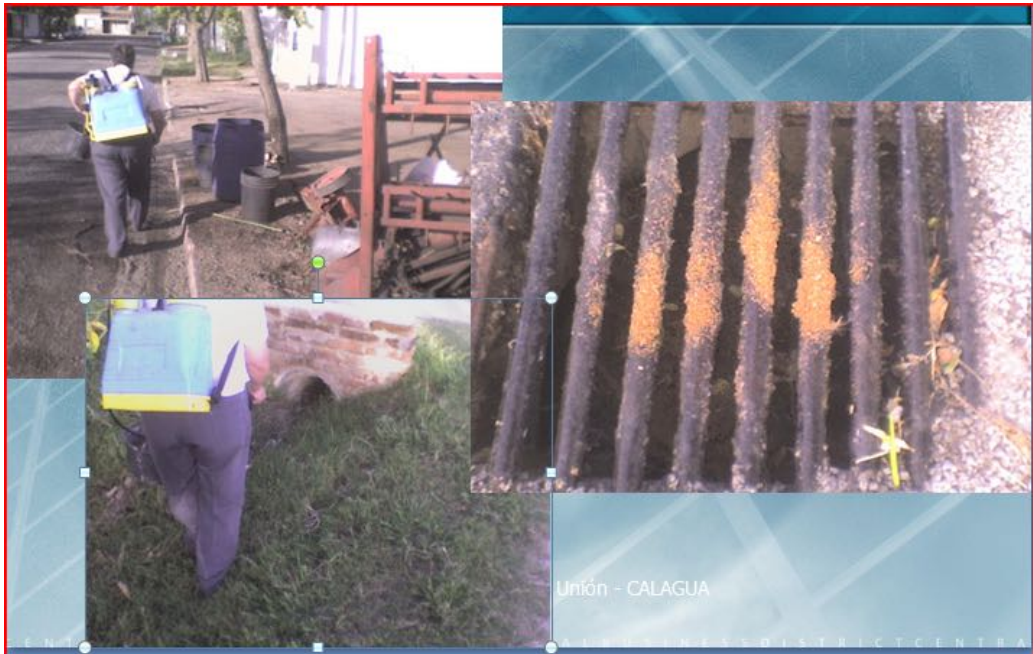
Imagen Nº 7. Aplicación de EM y Bokashi en las alcantarillas y cunetas. Rodó. Soriano