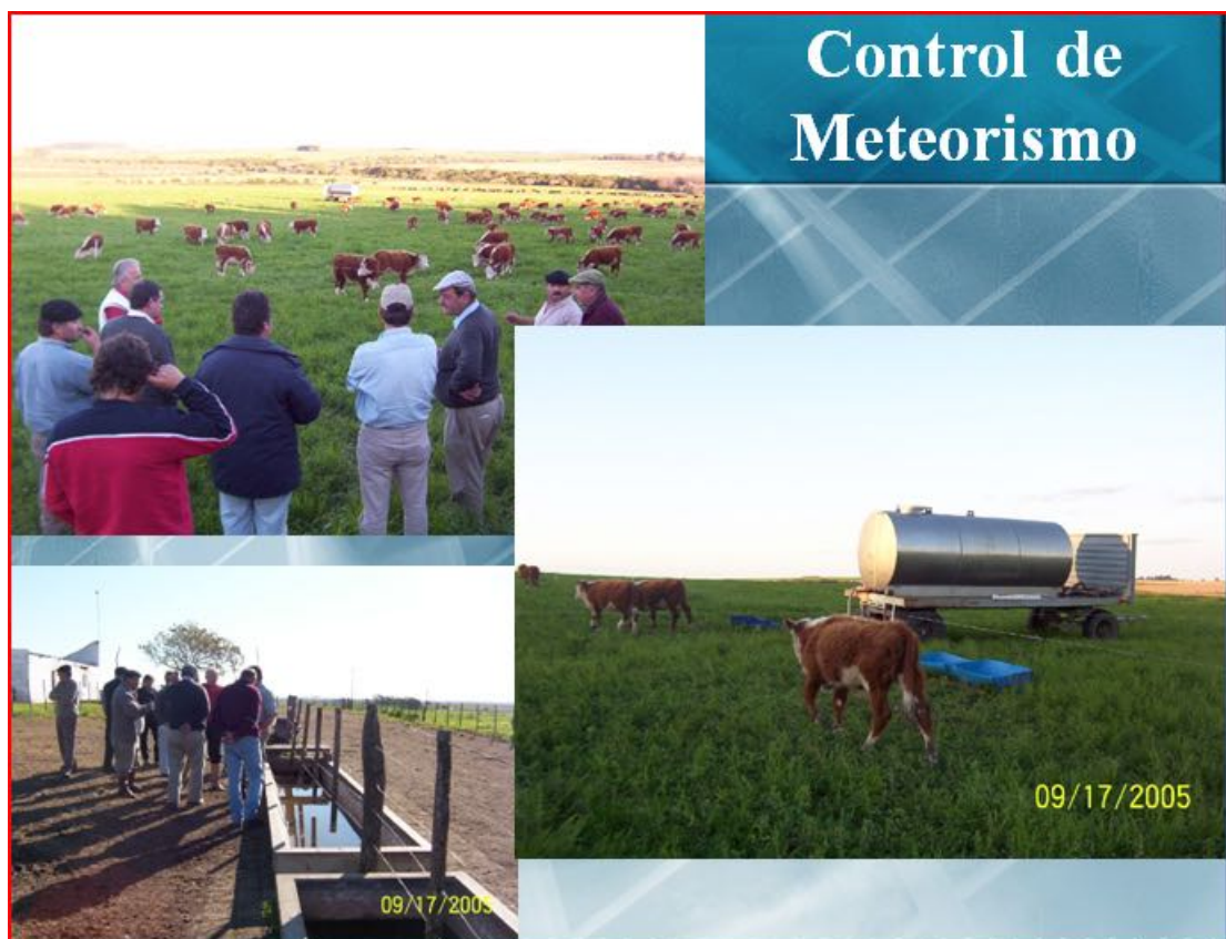
Imagen Nº 18. Pruebas realizadas en Soriano para controlar el meteorismo de bovinos con EM