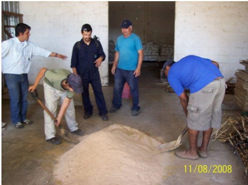
Imagen N° 4. Mezclando el afrechillo y la harina de pescado en la preparación de Bokashi