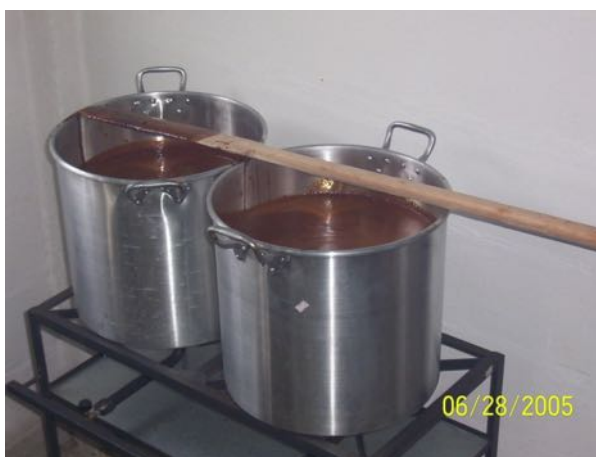
Imagen Nº 2. Calentando la melaza para activar el EM.

Usted podrá encontrar el EM – Activado en las Unidades de Activación propagadas por todo el país o podrá activarlo Usted mismo como se explica en el punto siguiente.