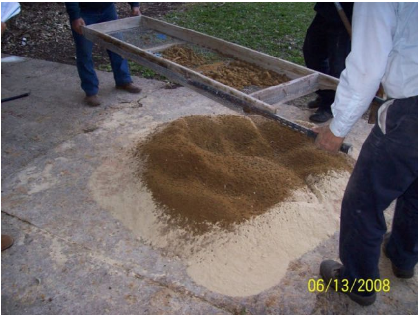
Imagen N° 3. Preparación de Bokashi. Zarandeando la harina de pescado sobre el afrechillo

Nota: el afrechillo de arroz tiene un tamaño de partícula muy fino por lo cual el mezclado con afrechillo de trigo, que es más grueso, permite un mejor mezclado