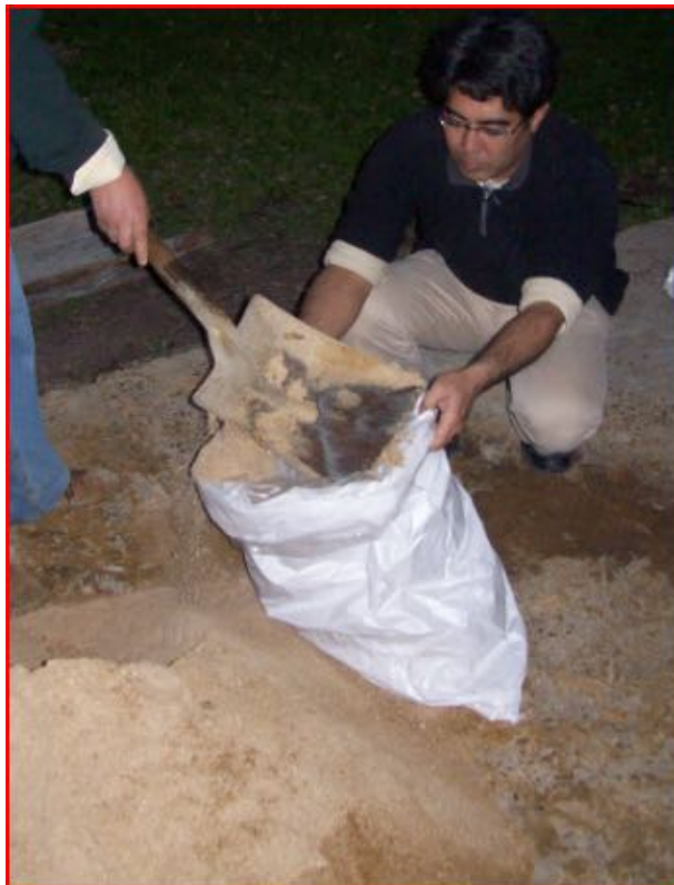
Imagen N° 6. Embolsando el Bokashi en una doble bolsa de polietileno por dentro y plastillera por fuera 10